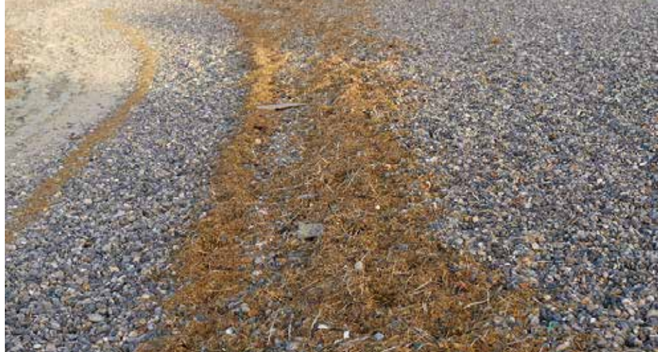
Plusieurs laisses de mer sur la plage du Hourdel à Cayeux-sur-Mer

On rencontre des laisses de mer sur toutes les plages du monde, qu'elles soient sableuses, rocheuses ou avec des galets. Il peut aussi y en avoir plusieurs simultanément sur la plage.