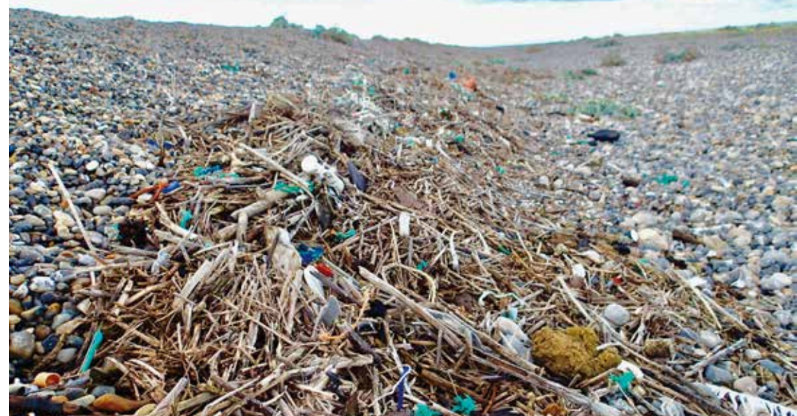
Laisse de mer à Cayeux-sur-Mer après une tempête et des grandes marées