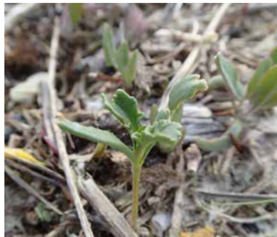
Petit plan de roquette maritime qui pousse dans la laisse de mer