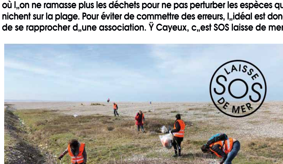
Des ramassages sont organisés par des associations, ici dans le Hâble avec SOS laisse de mer

Il est conseillé de pas improviser de nettoyage de plage sans connaître et préalable les consignes de sécurité. Il y a aussi des saisons - printemps - où l'on ne ramasse plus les déchets pour ne pas perturber les espèces qui nichent sur la plage. Pour éviter de commettre des erreurs, l'idéal est donc de se rapprocher d'une association. À Cayeux, c'est SOS laisse de mer !