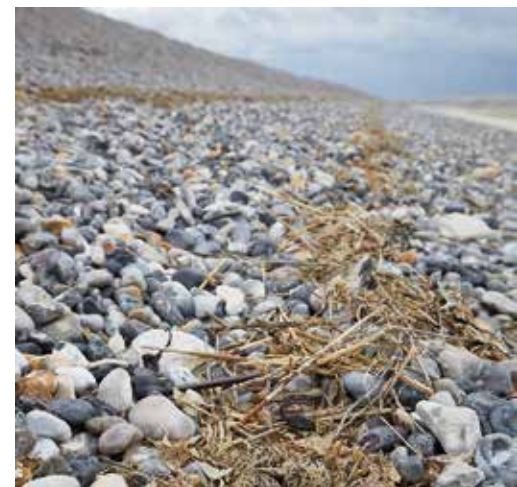
Petit nid de gravelot à collier interrompu dans la laisse de mer